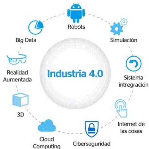
Ilustración 1: Industria 4.0

La manufactura avanzada e industria 4.0 ofrece una serie de ventajas para el desarrollo, mejora y sofisticación de los sectores productivos, tales como nuevas oportunidades de negocio, mayor eficiencia y eficacia de producción y en relación con capital humano, ofrece oportunidades para mejorar la seguridad de las operaciones, mejorar la calidad de vida de los trabajadores o capturar talentos más capacitados para generar ventajas competitivas en el mercado. Para poder aprovechar estas oportunidades, es necesario contar con: